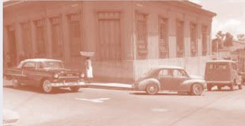
Centro de San Salvador, 1957.