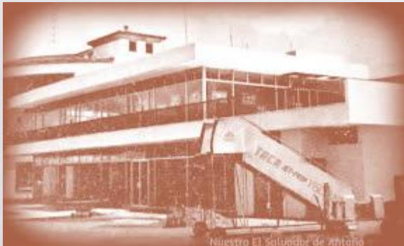
1964, Aeropuerto Internacional de Ilopango, vista parcial del edificio

Presión social, acusaciones políticas y dificultades personales. Aparente fracaso con propósito espiritual.